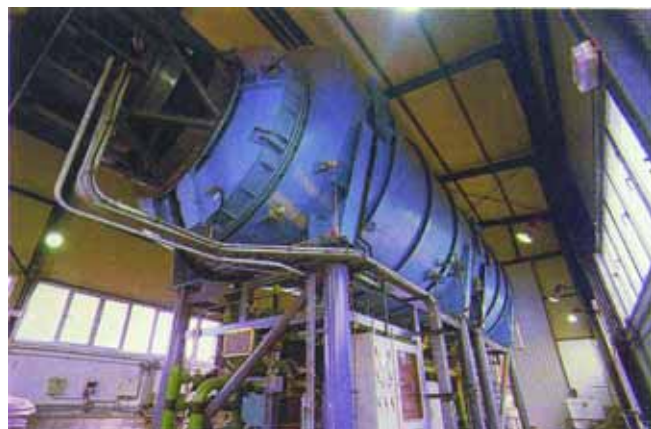
Planta dessaladora d'aigua de mar.