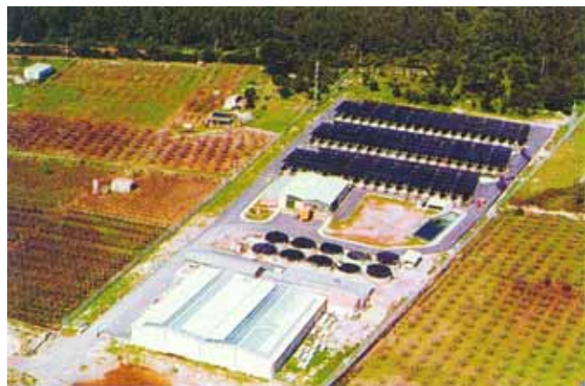
Piscifactoria d'Es Murterar.